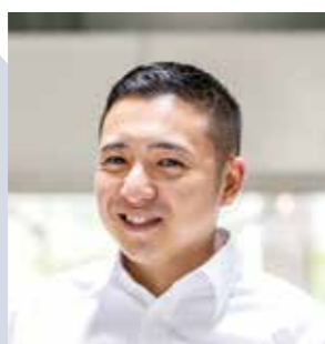
捜査支援分析管理官付 係員 令和3年入庁

A 私は現在、犯罪統計業務を行っております。毎日都道府県警察からさまざまな犯罪情報のデータが届き、その内容に誤りが無いか審査をしております。犯罪統計は日本の治安状況を国内外に示す重要な統計となっており、正確性が求められております。