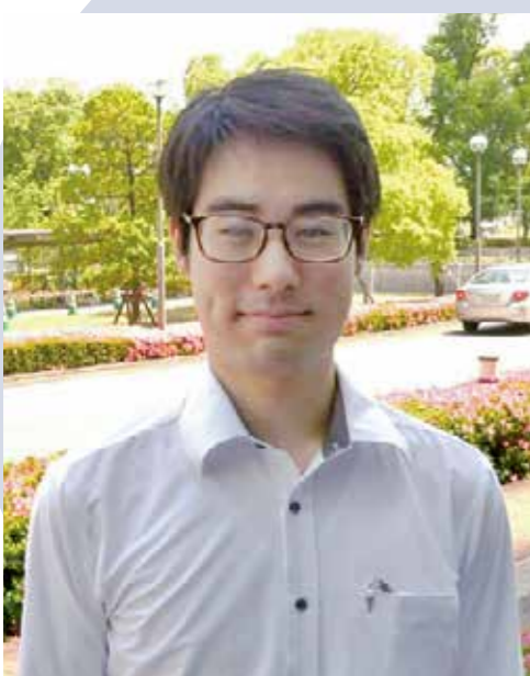
近畿管区警察局大阪府情報通信部 通信庶務課 係員 令和3年入庁

A 警察庁事務官は社会の安心安全を守る警察組織の基盤を支えるという、やりがいのある業務に携わることができます。福利厚生も整っており、私生活も充実した毎日を送ることができる職場です。警察組織というと警察官をイメージされる方が多いと思いますが、事務官も組織にかけがえない存在の一つであり、警察職員としての誇りをもって仕事ができます。是非、警察庁の業務説明会や官庁訪問に参加してみてください。皆さんと一緒に働けることを楽しみにしています。