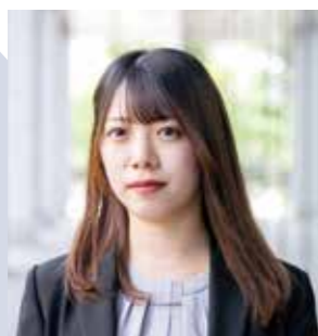
組織犯罪対策第二課 係員 令和3年入庁

A 警察組織は「男社会」「上下関係が厳しい」というイメージが強いと思います。しかし実際は業務内容や職場の雰囲気も性別に縛られることなく、女性はもちろん、誰もが十分に活躍できる場となっています。上司や先輩方は仕事の悩みからプライベートについてまで親身になって話を聞いてくださり、とても働きやすい環境です。勤務所属や年齢等に関わらず、気さくに話して下さる職員に囲まれ、真剣に業務に取り組む中でも楽しく充実した毎日を送ることができる職場だと感じています。