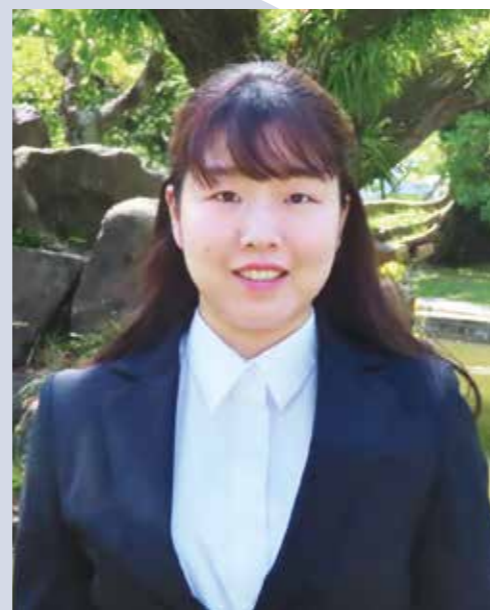
中国四国管区警察局警務課 係員 令和3年入庁

A 大学で警察局の説明会があり、警察庁事務官は、行政職員として国民の皆様の安全・安心に寄与できると知り、関心を持ちました。職員の方とお話するなかで、警察庁事務官は、一人ひとりが警察活動の一端を担い、管区内や全国の治安に関わる重要な仕事に携わることを知り、警察庁で仕事をする意義や仕事に対する誇りを感じました。また、職員の方の明るく親切的な対応と、職員の方々の楽しそうな雰囲気から、職場の風通しの良さを感じたことも決め手になりました。