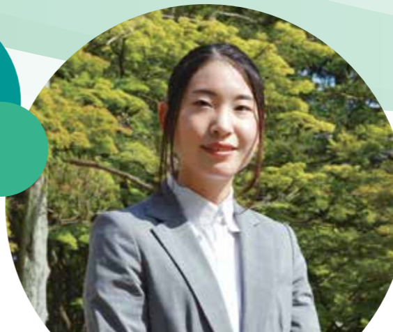
東北管区警察局警務課 係員 令和2年入庁