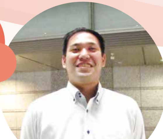
会計課 係員 平成27年入庁