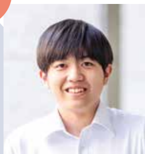
捜査第一課 係員 令和4年入庁

A 全国警察の中核であり、警察行政の基盤を支えるという大きな規模で仕事ができる警察庁に魅力を感じ入庁を決意しました。また、官庁訪問の際、緊張していた私を見た先輩職員の方が積極的に雑談してくださったことで、緊張をほぐすことができました。その時の先輩方の、周りを見て行動し、親切に接する姿に強い魅力を感じました。そこで、「私もこのような方がいる職場で働きたい」と強く思うようになり、入庁したいという決意が固まりました。