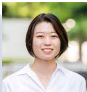
保安課 係員 令和4年入庁

A 警察庁事務官は、最前線で働く職員が安心して業務に取り組めるようサポートをする大切な役割であり、警察組織の基盤を支えるという大きなやりがいを感じながら働ける仕事です。一人一人が誇りと使命感を持って日々の業務を行っています。また、休暇を取得しやすい職場であり福利厚生も整っているため、気分転換をする機会も多く公私ともに充実した生活を送ることができます。