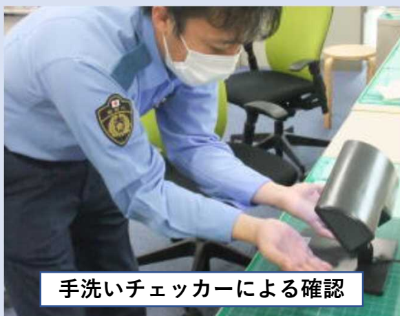
手洗いチェッカーによる確認