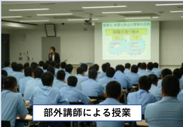
部外講師による授業