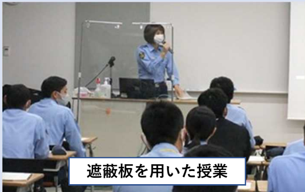
遮蔽板を用いた授業